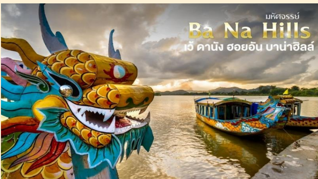
มหิตจรรย์ Ba Na Hills เว้ คานิง ฮอยอัน บานาฮิลล์

ลงเรือมังกรล่องแม่น้ำหอม พร้อมชมการแสดงและดนตรีพื้นเมือง