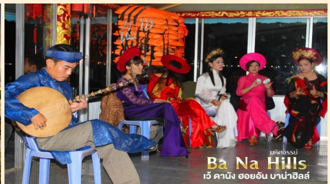
มหิตจรรย์ Ba Na Hills เว้ คานิง ฮอยอัน บานาฮิลล์