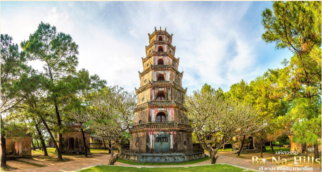
มหิตจรรย์ Ba Na Hills เว้ คานิง ฮอยอัน บานาฮิลล์

นำท่านชม เจดีย์เทียนมู่ ทรงเก๋งจีนแปดเหลี่ยมสูงลดหลั่นกัน 7 ชั้นซึ่งแต่ละชั้นแทนภาพต่าง ๆ ของ พระพุทธเจ้า ตั้งเด่นอยู่ริมฝั่งแม่น้ำหอม