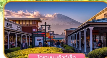
โกเทมบะเฮ้าท์เล็ท