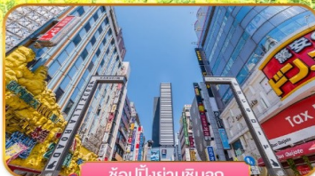
ช้อปปิ้งย่านชินจูกุ