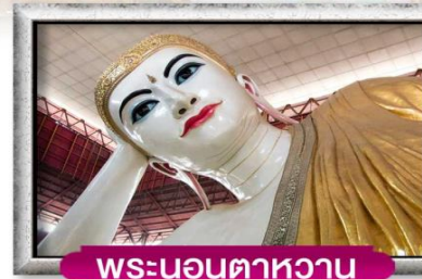
พระนอนตาหวาน