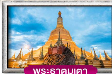
พระธาตุมูเตตา