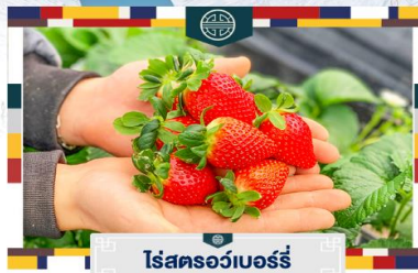
ไร่สตอร์เบอร์รี่