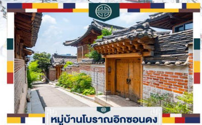
หมู่บ้านโบราณอิกซอนดง